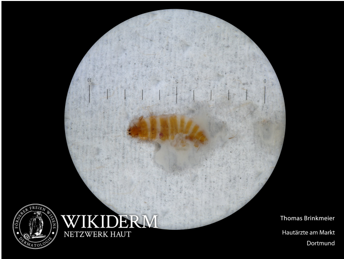
📍 Larve vom Museums- oder Teppichkäfer, Abb. 2