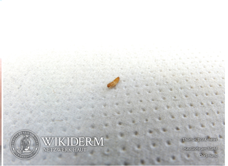
📍 Larve vom Museums- oder Teppichkäfer, Abb. 1