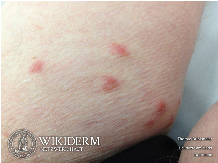
📍 Iktusreaktion, Museums- oder Teppichkäfer