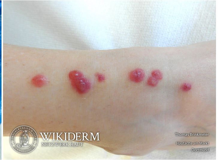
📍 Iktusreaktionen, multiple bullöse, Fall 2