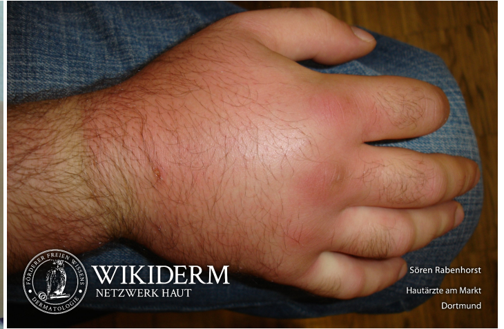
Iktusreaktion, hypererg, Handrücken