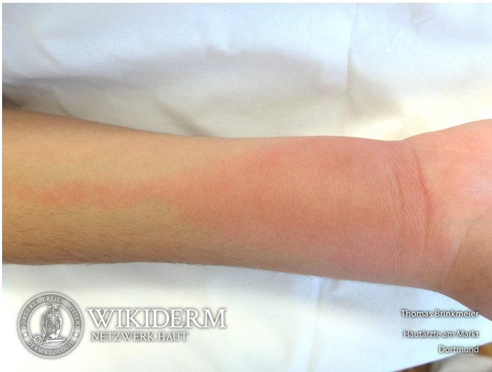
Iktusreaktion mit Lymphangitis