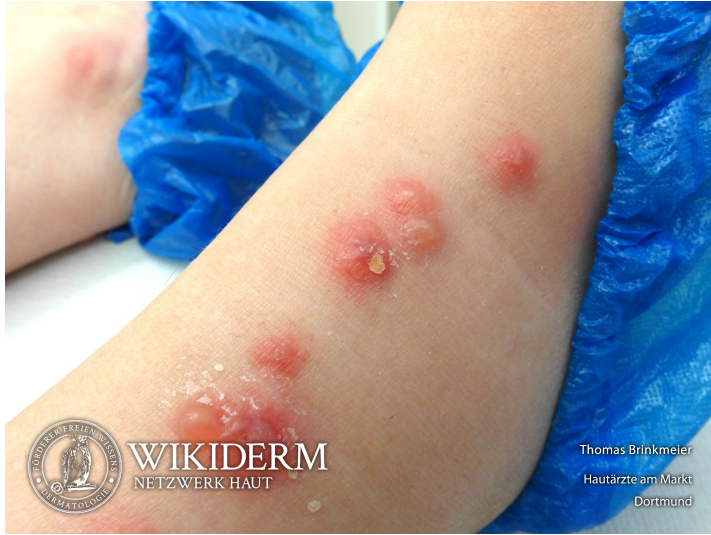
📍 Iktusreaktionen, multiple bullöse